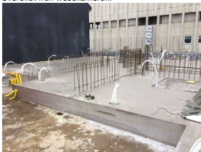
Hela bjälklaget gjutet.

Följ bygget via vår webbkamera! Ni hittar länken på Arvika.se eller gå direkt till Webbkameror.se