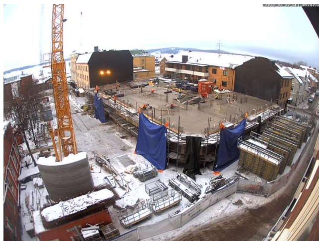
Överblick från webbkameran.

Platsledning, snickare, betongarbetare, utsättare, rörläggare, elektriker, murare